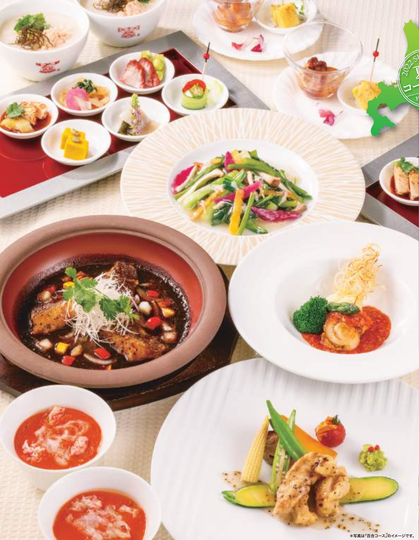
*写真は「百合コース」のイメージです。

北海道の広大な大地で育った畜産、そして3つの海(日本海・オホーツク海・太平洋)のそれぞれで獲れた凝縮されたおいしさに育った海産物。それらのおいしさを活かした、丸ごと北海道が楽しめるコース料理をご満喫ください。