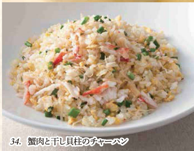
34. 蟹肉と干し貝柱のチャーハン