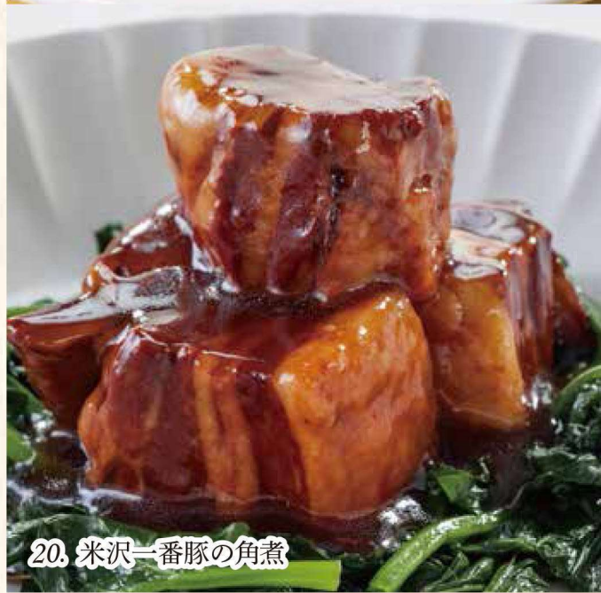
20. 米沢一番豚の角煮