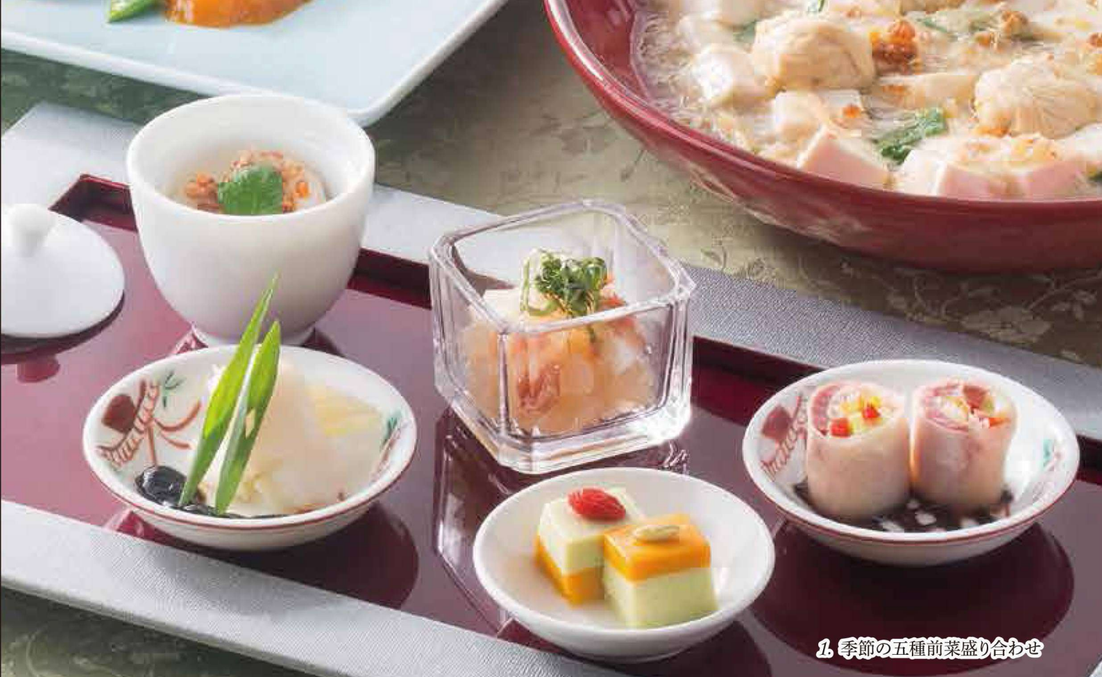
1 季節の五種前菜盛り合わせ