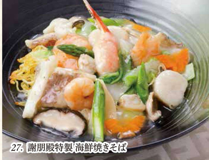
27. 謝朋殿特製 海鮮焼きそば

六種類の海鮮とたっぷり野菜の旨みを贅沢に引き出し、海鮮醬でコクと旨みをプラスした塩味のおんかけ焼きそば。