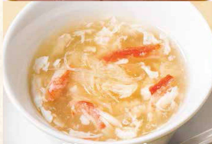
10. フカヒレと蟹肉のやさしいスープ (塩味または醤油味)