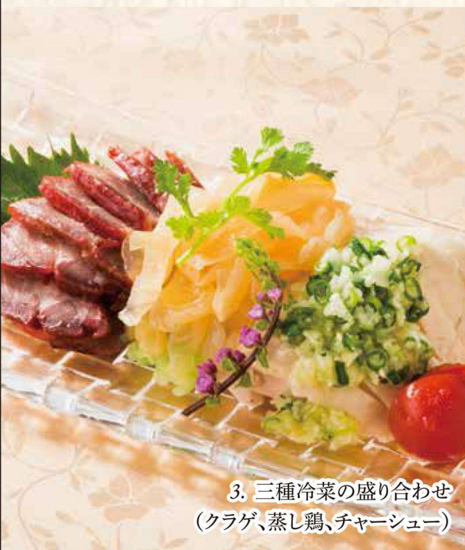
3 三種冷菜の盛り合わせ (クラゲ、蒸し鶏、チャーシュー)