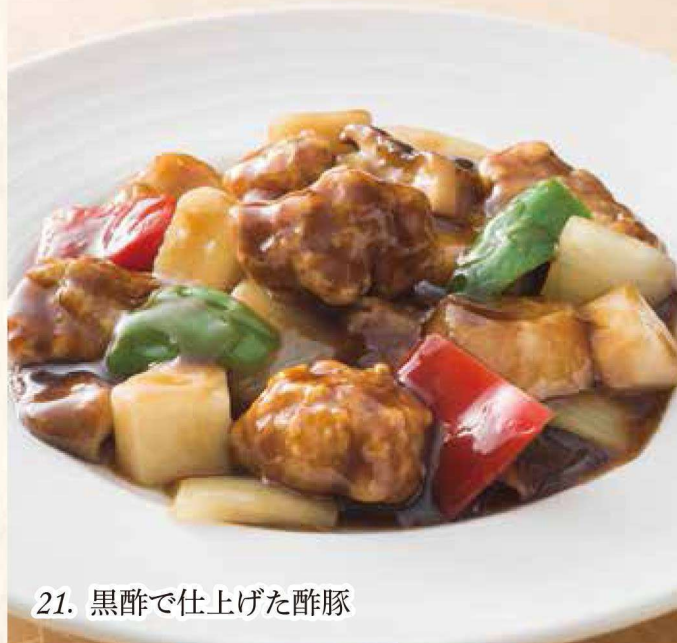
21. 黒酢で仕上げた酢豚