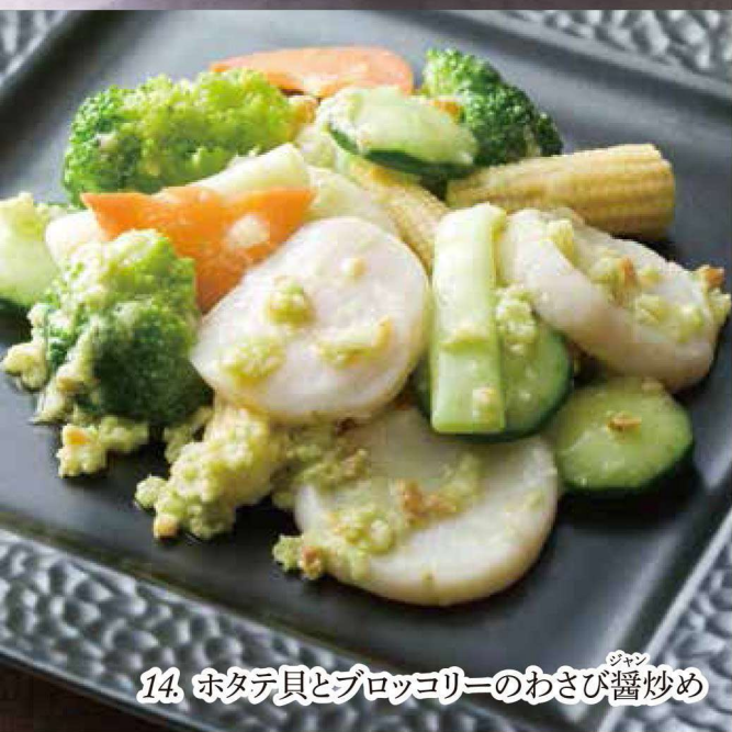
14. ホタテ貝とブロッコリーのわさび醬炒め