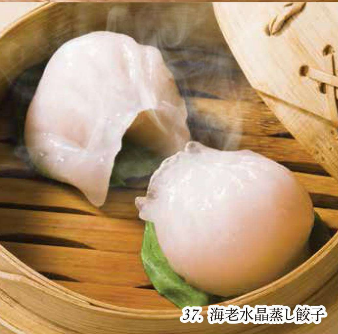
37. 海老水晶蒸し餃子