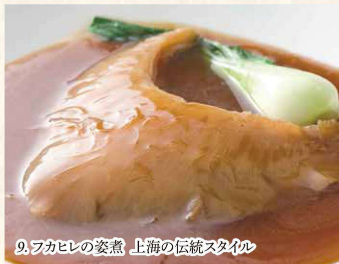
9. フカヒレの姿煮 上海の伝統スタイル