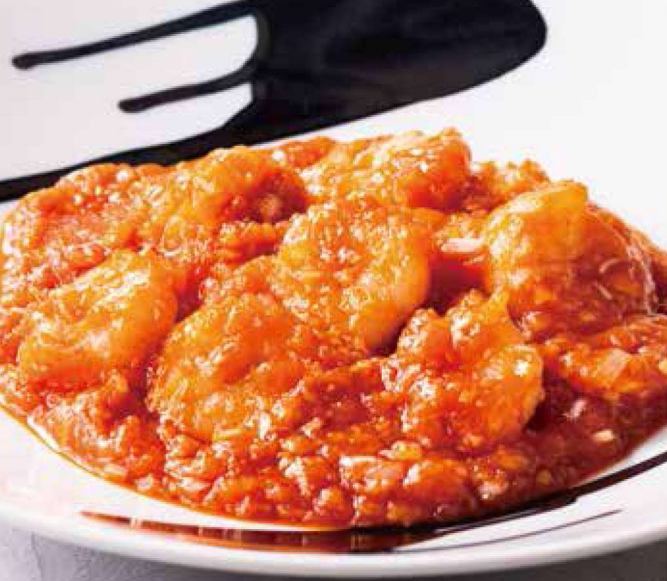
12. 海老のチリソース