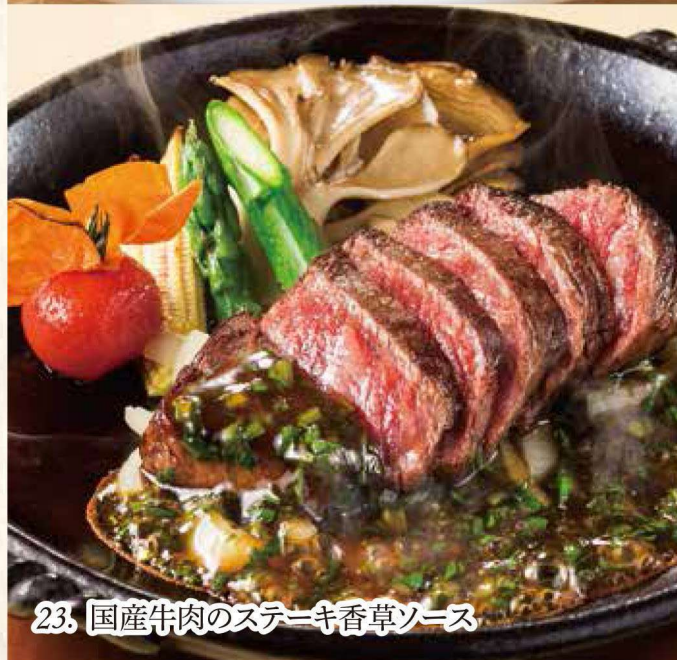
23. 国産牛肉のステーキ香草ソース