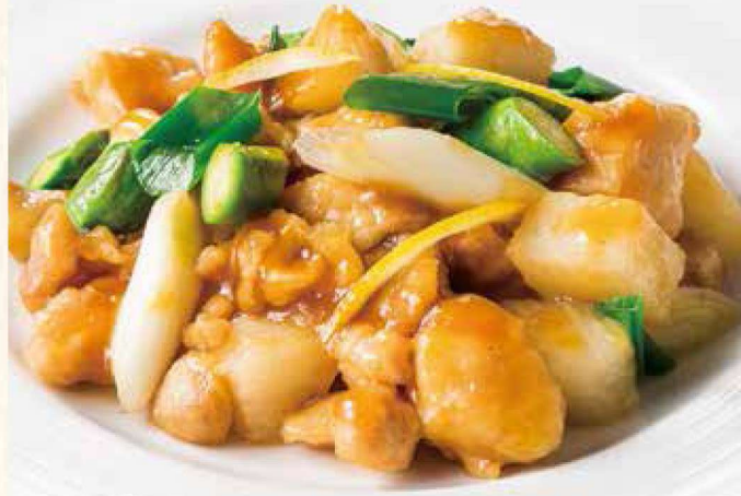
19. 健味鶏とアスパラの柚子胡椒 ジャン 炒め