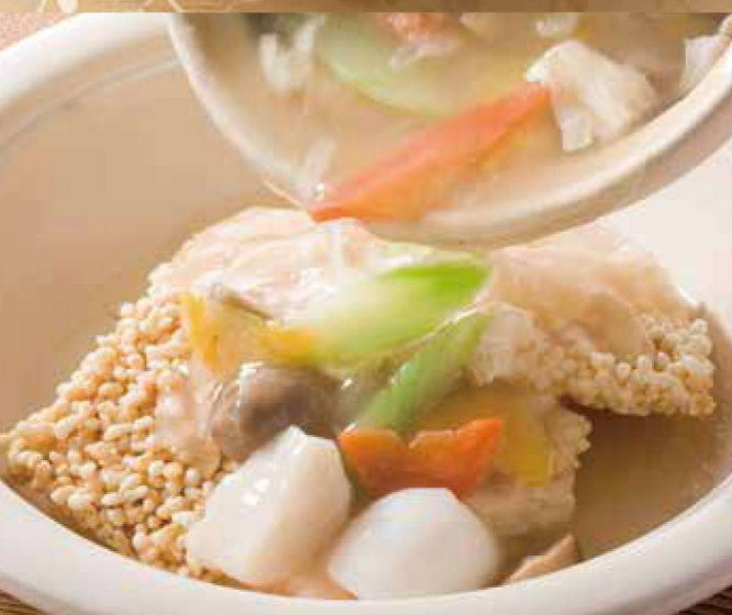
17. 中華おこげの贅沢海鮮あんかけ