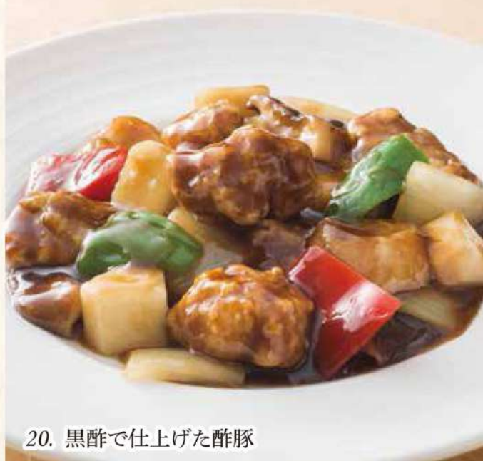
20. 黒酢で仕上げた酢豚