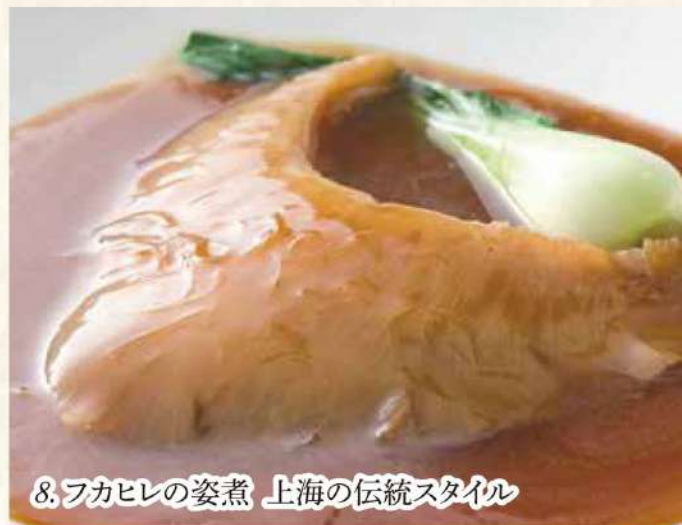
8. フカヒレの姿煮 上海の伝統スタイル