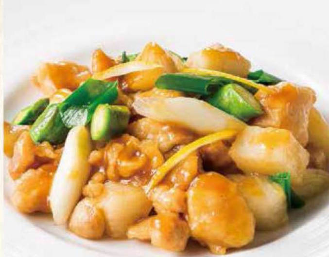
18. 健味鶏とアスパラの柚子胡椒炒め