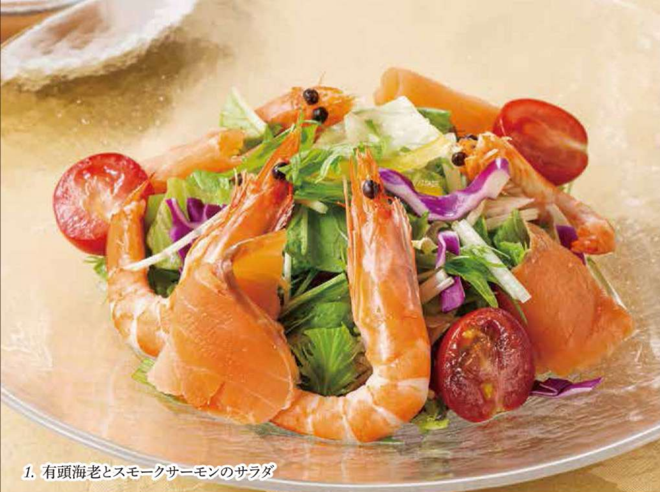
1. 有頭海老とスモークサーモンのサラダ