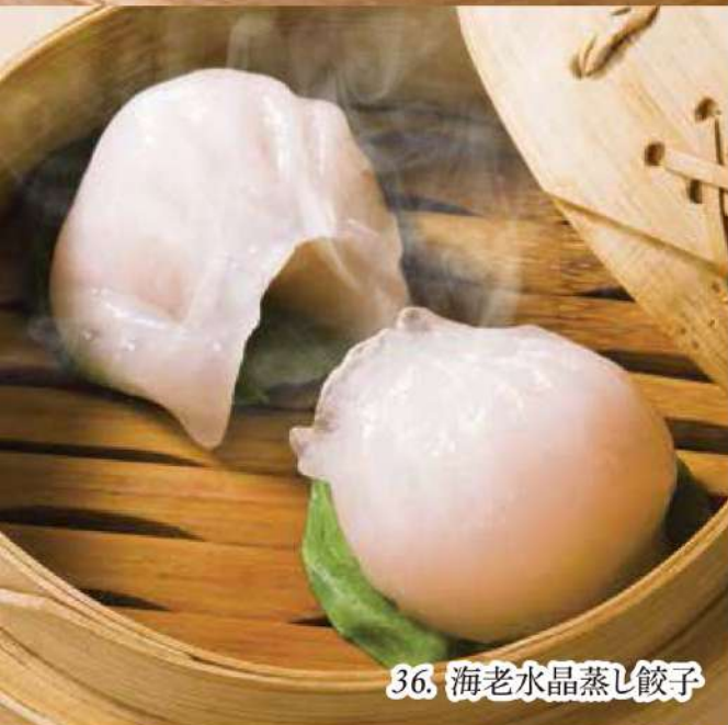
36. 海老水晶蒸し餃子