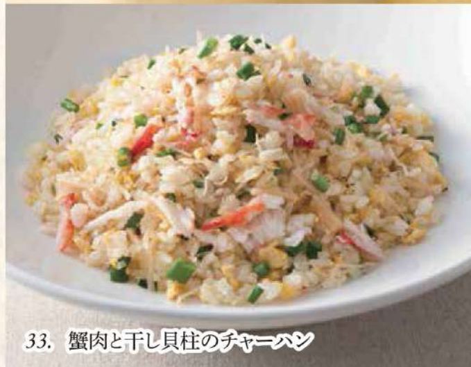
33. 蟹肉と干し貝柱のチャーハン

什錦湯麵 Noodles in Soy Soup with Assorted Meat and Vegetables