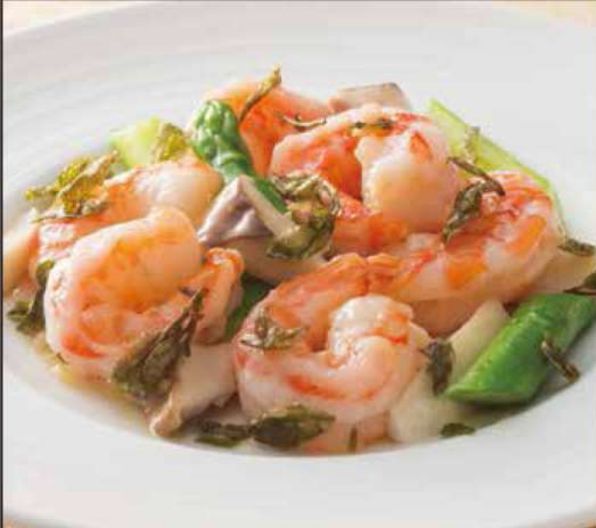
10. 天然海老の龍井茶葉香り炒め