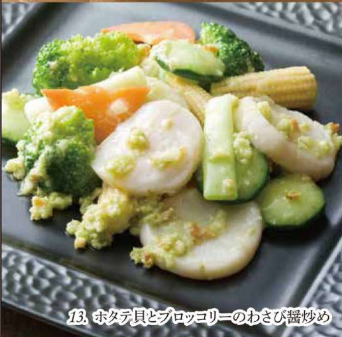
11. ホタテ貝とブロッコリーのわさび醬炒め