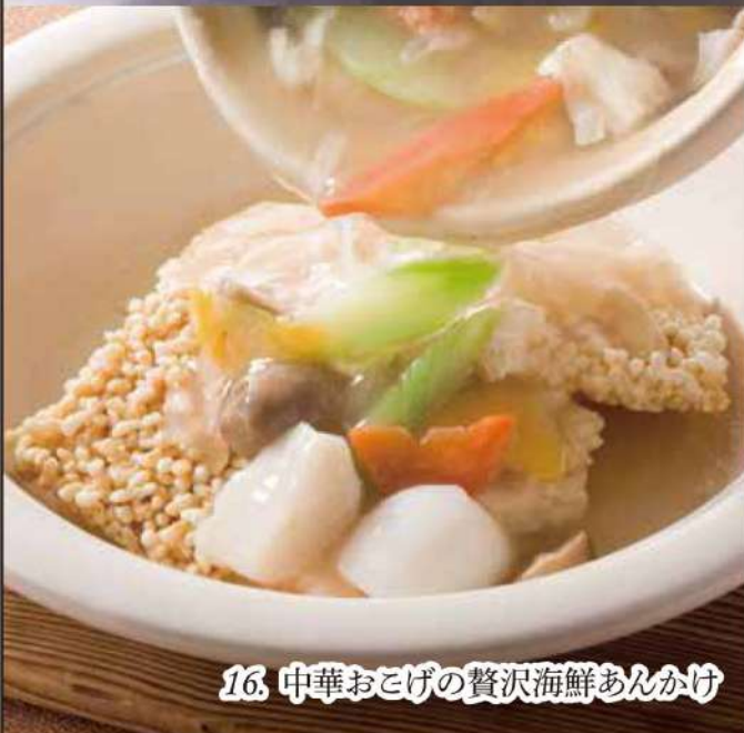
16. 中華おこげの贅沢海鮮あんかけ