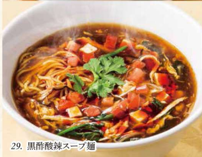
29. 黒酢酸辣スープ麵