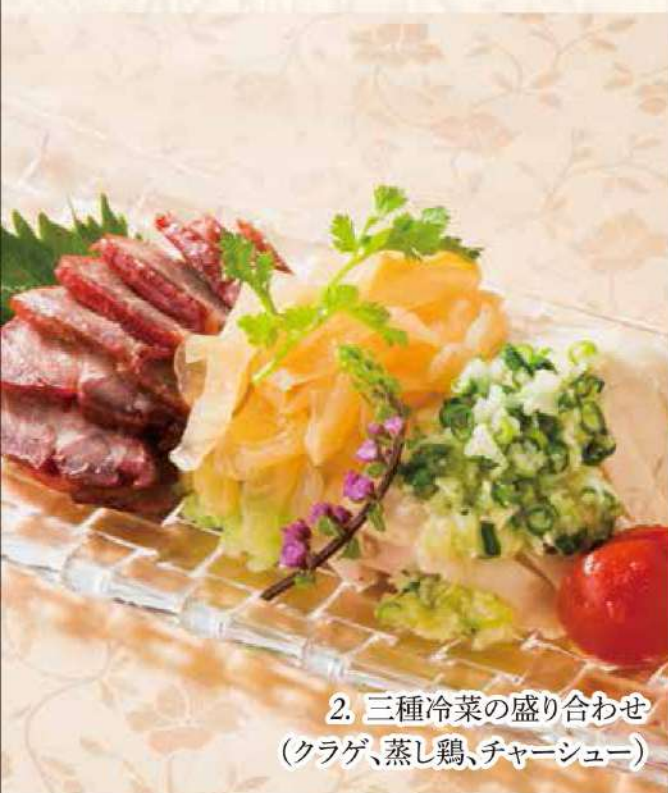
2. 三種冷菜の盛り合わせ (クラゲ、蒸し鶏、チャーシュー)