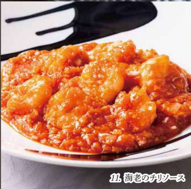
11. 海老のチリソース