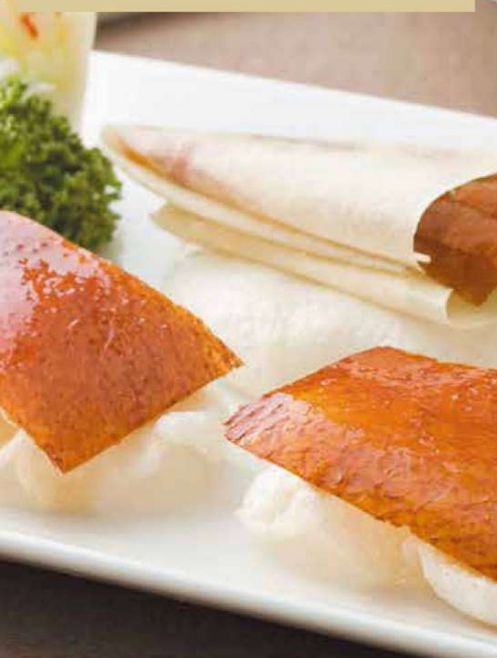
25. 北京ダック〜じっくり煮詰めたオリジナル甜麵醬で〜

パリッと香ばしく仕上げた香りと食感を、 じっくり煮詰めた味噌で お楽しみください。