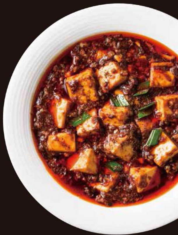
23. 謝朋殿 白麻婆豆腐

二種類の豆板醤、花椒を使用した 痺れる辛さと香りの四川麻婆豆腐。 牛肉を使用したことで、コクのある 旨みに仕上がっています。