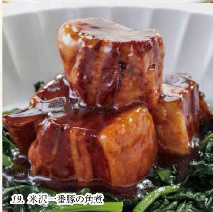
19. 米沢一番豚の角煮