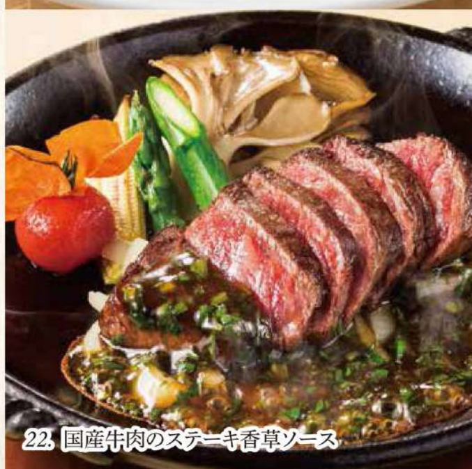
22. 国産牛肉のステーキ香草ソース