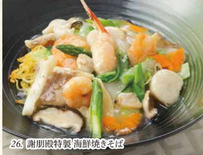
26. 謝朋殿特製 海鮮焼きそば

六種類の海鮮とたっぷり野菜の旨みを贅沢に引き出し、海鮮醬でコクと旨みをプラスした塩味のおんかけ焼きそば。